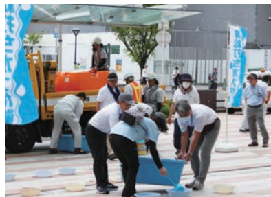
▲打ち水大作戦(サンポート高松)