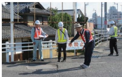
▲香川道路施設管理部会(一般国道11号現地調査)