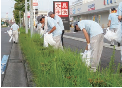
▲88クリーンウォーク四国(本所)

「ボランティアサポートプログラム」では、高知支所から職員11名、徳島支所から職員6名が清掃活動に参加しました。