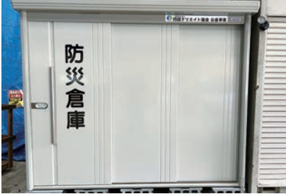
▲道の駅「小田の郷せせらぎ」の防災倉庫（内子町）

「道の駅」の防災機能向上のため、四国管内の道の駅に平成28年度から防災倉庫等の防災用品の調達を支援しています。令和5年は6駅へ防災倉庫、発電機、投光器などの防災用品を寄贈しました。