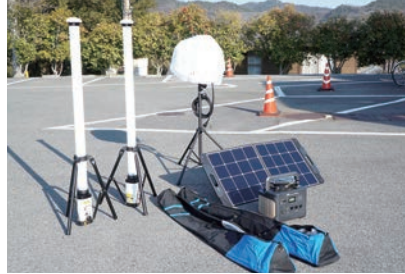
▲道の駅「小豆島ふるさと村」の防災備品（小豆島町）