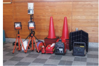
▲道の駅「大坂城残石記念公園」の防災備品（土庄町）