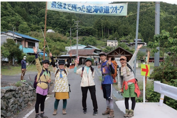
▲(地域の誇れる道)空海をたどるいやしの道ウォーク