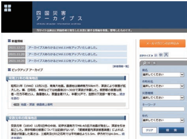
▲四国災害アーカイブス トップページ URL: https://www.shikoku-saigai.com/

平成24年7月のホームページ開設以来、90万件を超えるアクセスがあり、うち令和5年度は、72,504件のアクセスがありました。令和6年能登半島地震発生時には、多くの方々に閲覧いただきました。