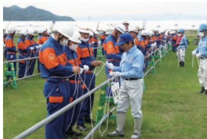
▲土器川水防工法技術支援 (土器川左岸生物公園前河川敷)