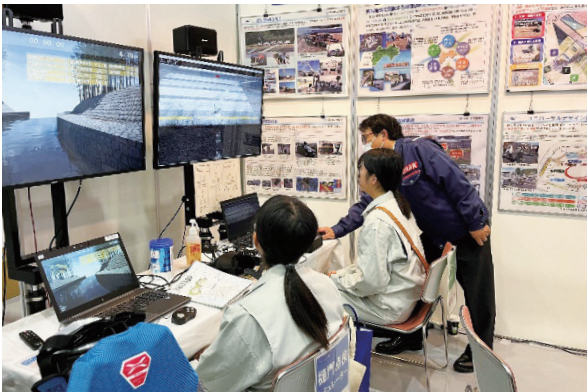
▲建設フェア四国2023 in 高松