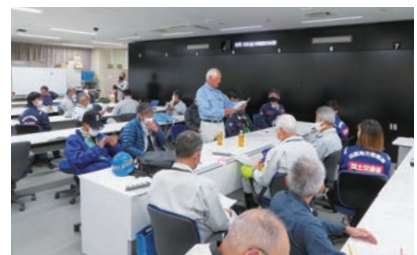
▲松山河川施設管理部会(重信川現地調査報告会)