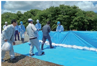
▲肱川水防工法訓練 (肱川防災ステーション)