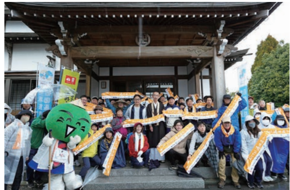
▲一日一斉「おもてなし遍路道ウォーク」