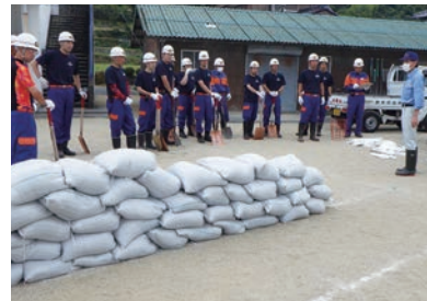
▲西予市水防工法訓練 (西予市立皆田小学校グラウンド)