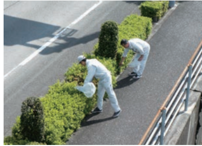
▲ボランティアサポートプログラム(高知支所)