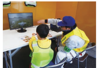
▲蛍湖まつり(中筋川ダム)