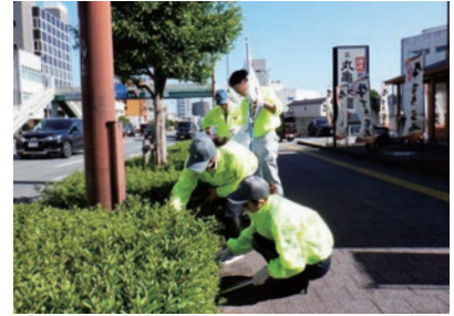
▲ボランティアサポートプログラム(徳島支所)

「重信川クリーン大作戦」には松山支所から職員7名が参加し、重信川の清掃活動をしました。