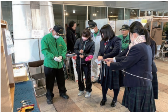
▲防災とボランティアのフェスティバル