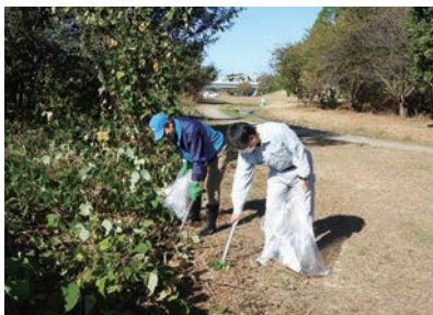
▲重信川クリーン大作戦

サンポート高松にて開催された「打ち水大作戦」に本所職員4名が準備から参加し、四万十支所は「蛍湖まつり」にてドローンシミュレーター体験のインストラクターを務めました。