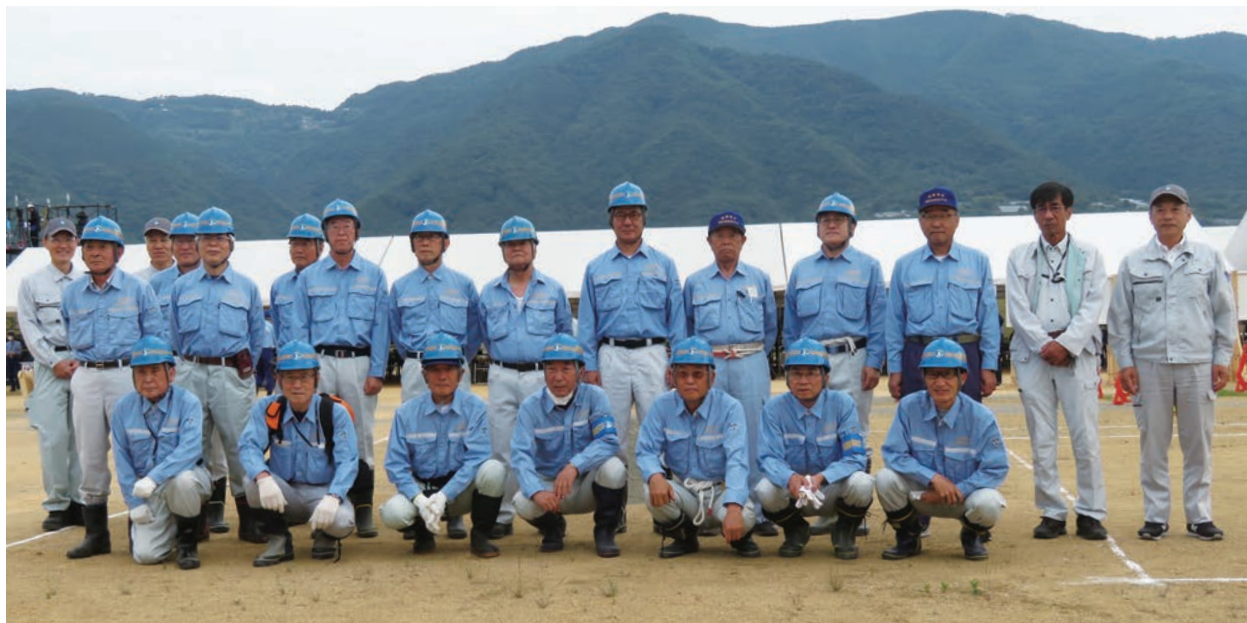
▲吉野川総合水防演習(西部健康防災公園)

公益事業は、当社が行う収益事業によって得られた収益を広く社会に還元する事業です。当社は昭和43年の設立から、四国に住む人々の幸せ多い生活を実現するために、各種支援事業(公益事業)に取り組み、四国の未来づくりに貢献しています。