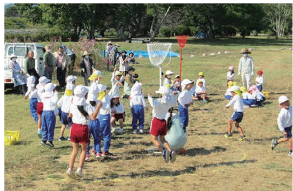
▲河川花いっぱい運動