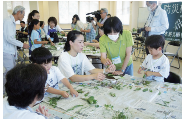
▲防災植物教室の開催