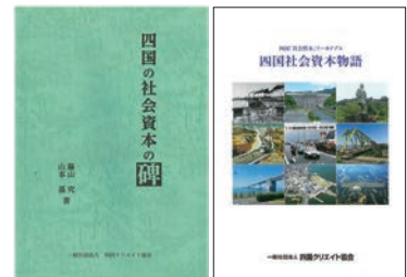
▲四国社会資本アーカイブスホームページ https://www.shikoku-shakaishihon.com