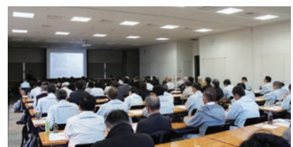
▲河川の維持管理技術に関する講演会(サンポート高松)

令和5年12月7日に河川の維持管理技術に関する講演会を、四国河川維持管理検討会、四国河川維持管理技術者会と当会の共催で開催しました。近年激甚化する豪雨災害の防災・減災と、老朽化が進行している河川管理施設の維持管理について、携わる技術者の技術力向上をテーマに約90名が参加し、管理する河川の現状と対策について熱心に講師へ質問をされていました。