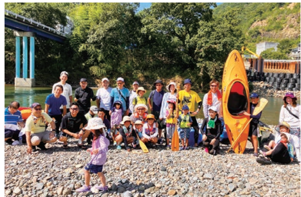
▲防災・環境講座「流域住民の意識高揚と将来を担う次世代育成」