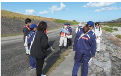
▲香川河川施設管理部会(土器川現地調査)

河川施設管理部会では、一級河川土器川、重信川、石手川の徒歩巡視と土器川の源流碑清掃を、道路施設管理部会では一般国道11号、32号の徒歩点検を実施しています。