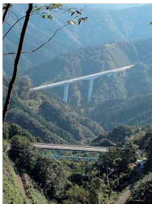
上：高速大坂谷川橋下：国道久礼坂第5橋

ここからすぐ下に、高速道路の出現で風景が一変、荒廃しているものの趣のある遍路道が分断され、急勾配の階段に取って代わり、それも最下部は高速道路の橋下をくぐる構造で300段以上あり、「新たなへんろ転がしの出現か!」の声あり。付け替え道路を設計した人には申し訳ないが、遍路みちや歴史の道には全く興味が無なく、苦勞して歩く人のことを配慮していない道の復元にしか見えなかったことが残念です。調査