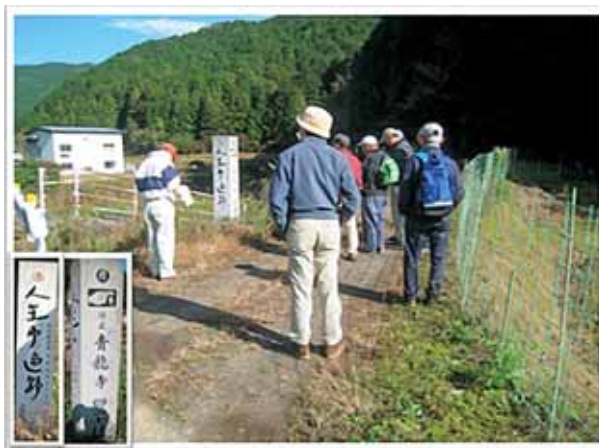
出発地点（県道41号枝道農道入口）

平成28年11月28日7時半ごろに高松を出発し、中土佐町と四万十町境の七子峠（標高293m）に10時半ごろに到着。峠の駐車場に車をおき、国道56号から旧大野見村へ向かう県道41号に移動、農道と兼用になっている遍路道に入る。今回は、うるう年と調査員の体力から逆打ちとし七子峠から久礼長沢谷に降りる。