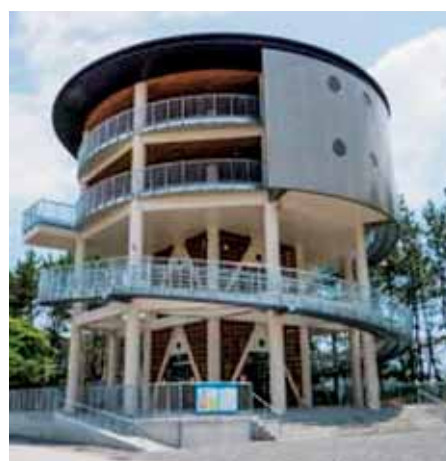
津波避難タワー（八千代タワー）

防災エキスパートのメンバーも兼ねていることから、「津波避難タワー」を見学して、中土佐ICより帰高した。