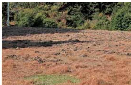
イノシシによる耕作

の人たちの作業現場と出くわす、そこには十六丁の丁石とコンクリートの橋を渡ったところに、明治7年の石灯籠と昭和11年製の新居田神社の鳥居がある。その先の一際日当たりの良