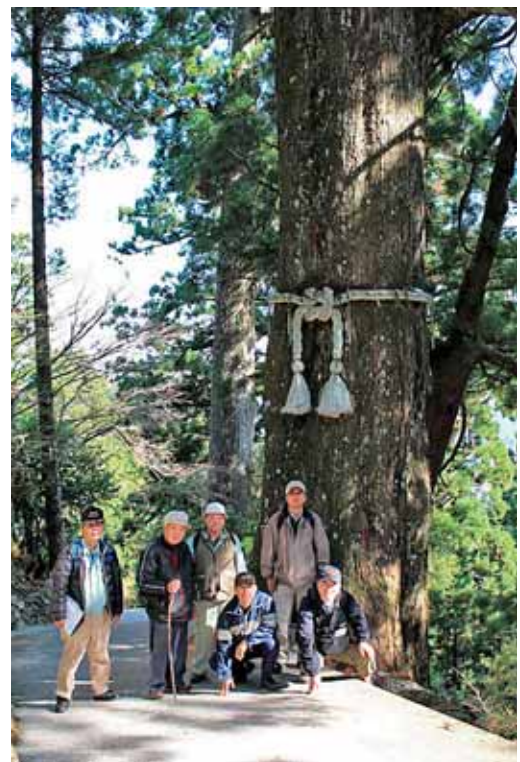
太龍寺手前参道の巨木

そこからはロープウェイに乗らず、事務局手配車の駐車場へ下っていく。途中、有馬・鍋島と共に日本三大怪猫伝の一つとして名高い「お松大権現」の前を通過し那賀川沿いに南下し帰路に着く。