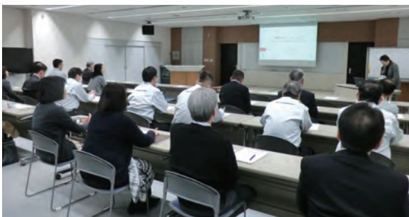
▲職場のメンタルヘルス&セクハラ講習会(本所)

本所では、2月に香川産業保健総合支援センターより講師を招き、職場のメンタルヘルス&セクハラに関する講習会を実施しました。ハラスメントの種類や対応方法、また、こころの病気との向き合い方を学びました。大切なことは、自ら気づくこと、みんなで助け合うこと、自分自身を大切にすること!