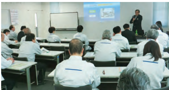
▲交通安全講習会(松山支所)

松山支所・大洲支所では、合同で2月に松山東警察署より講師を招き、交通安全講習会を実施しました。危険予測のポイントなどを教えて頂きました。これからの安全運転を心がけ業務に努めて参ります。