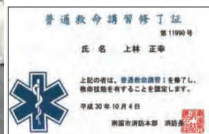
▲普通救命講習修了証