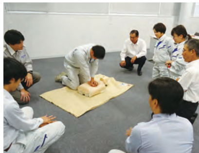
▲救命講習の実習中(高知支所)

高知支所では、10月に南国市消防局より講師を招き、胸骨圧迫や人工呼吸、AED操作など心肺蘇生の方法を実習しました。支所設置のAEDの操作を含め、救急技能の習得を図り、参加者全員が講習修了証の交付を受けました。